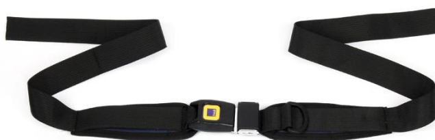
2- punkt säkerhetsbälte